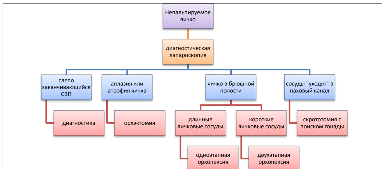
Рисунок 2 – Алгоритм диагностики и хирургического лечения при СНЯ.

В анализ результатов лечения мальчиков с СНЯ за период с 2009 г по 2016 г вошел 141 пациент: из них 99 оперированы классическими «открытыми» способами, а 42 пациента – с использованием лапароскопических технологий. С 2009 г по 2011 г в урологическом отделении ДРКБ МЗ РТ операции при СНЯ у мальчиков выполнялись по методике ЕЛД (19 пациентов), с 2011 г по 2016 г при операциях у пациентов с СНЯ использовалась одностроакрная методика (23 пациента). Показание для операции - отсутствие яичка в мошонке и невозможность определить его в паховом канале при физикальном обследовании и ультразвунографии. Обследование и лечение детей с СНЯ проводилось по предложенному нами алгоритму диагностики и лечения (рисунок 2).